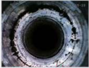
CABEZAL DE CÁMARA DE 8.5MM SE ADAPTA A LA MAYORÍA DE LOS AGUJEROS DE BUJÍAS