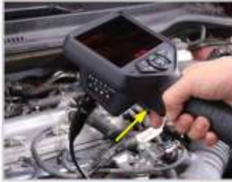
1BOTÓN FOTO/VIDEO BOTÓN DE DISPARO: FÁCIL DE USAR CON UNA MANO