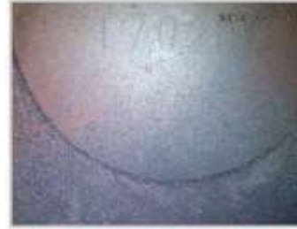
LINTERNA LED BRILLANTE SÓLO MV480